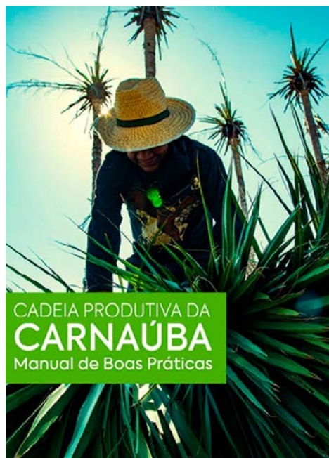
Manual de Boas Práticas na Cadeia da Carnaúba