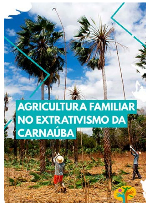
Agricultura Familiar no Extrativismo da Carnaúba